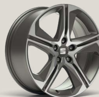
Performance 2 FR PUN