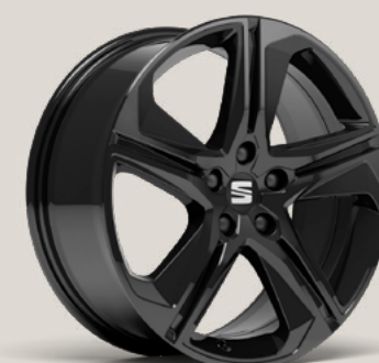
Performance Black Pack FR C2K