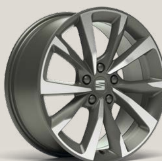
Performance FR PUK