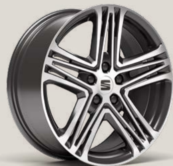
Performance FR PUM