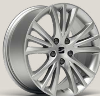
Dynamic Ste PUA