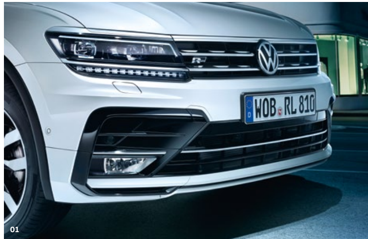
01 De chromen lamellen in de grille en de dynamische lijnen op de motorkap lopen stijlvol over in de LED-koplampen. MU

Het robuuste design van de Tiguan verklaart direct waar hij toe in staat is. Wil je echt overal uit de voeten kunnen? Kies dan voor een vierwielaangedreven uitvoering met 4MOTION Active Control. Hierbij heb je de keuze uit verschillende rijstijlopties, zoals Snow, Onroad en diverse off-road-instellingen. Ultieme vrijheid.