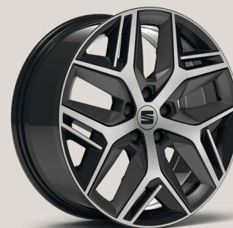
Exclusive Cosmo Grey Type 1