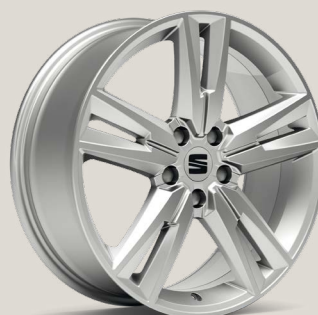
Performance Brilliant Silver type 2