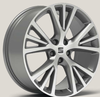
Exclusive Nuclear Grey