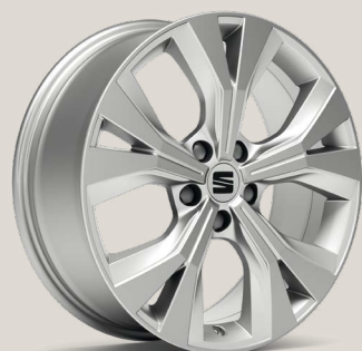
Performance Brilliant Silver type 1