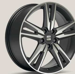
Performance Cosmo Grey