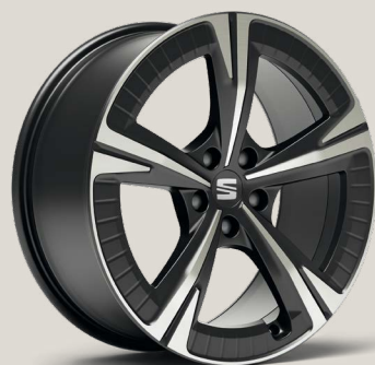
Aerowheels Cosmo Grey