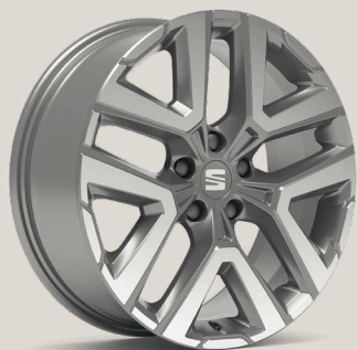
Performance II Nuclear Grey