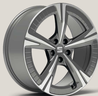
Aerowheels Nuclear Grey