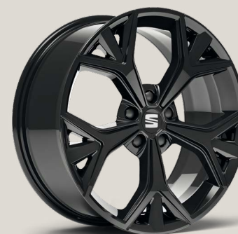
Exclusive Glossy Black