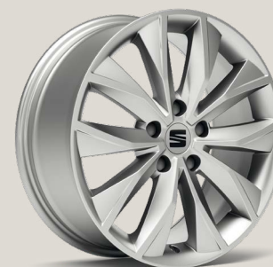
Dynamic Brilliant Silver