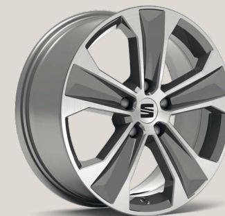
Dynamic Nuclear Grey