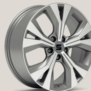
Performance Nuclear Grey