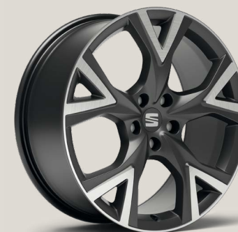
Exclusive Cosmo Grey Type 2