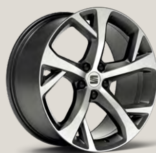
Cosmo Grey FR