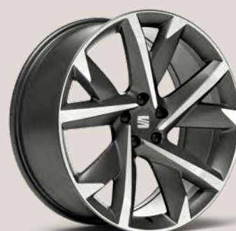
Cosmo Grey FR