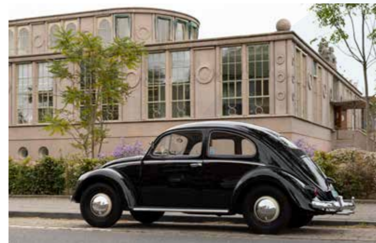
De Volkswagen Kever 1200 (ovaal) staat te pronken voor het Onderwijsmuseum in Dordrecht. Het 'Ovaaltje' treft u in originele staat bij Ames in Dordrecht.

De Volkswagen ID.3 is een bijzondere elektrische auto