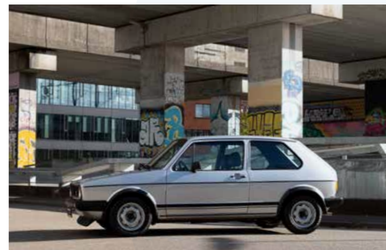
De Volkswagen Golf GTI van Ames komt uit het jaar 1979 en heeft een 1600 cc blok 110 pk. De auto verkeert in 100% originele staat en kan inmiddels gerekend worden tot een zeer geliefde klassieker.