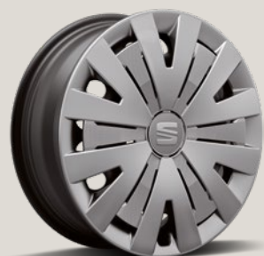
URBAN WIELDOPPEN R