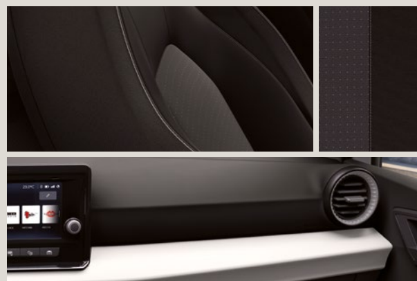
COMO STOF COMFORT SEATS