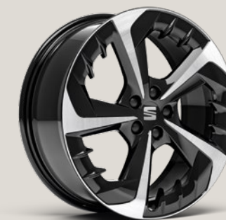
PERFORMANCE BLACK R MACHINED FR FBI FR+