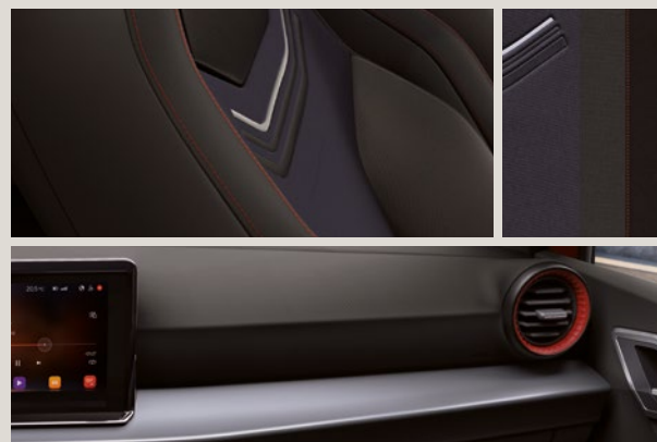
LE MANS STOF SPORT SEATS