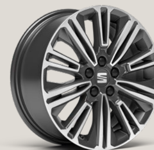
DESIGN NUCLEAR GREY MACHINED St SBI