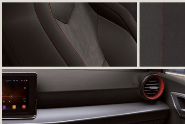
DINAMICA® BLACK SPORT SEATS