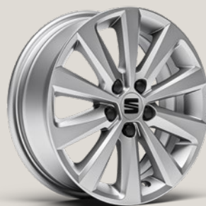
ENJOY BRILLIANT SILVER St SBI