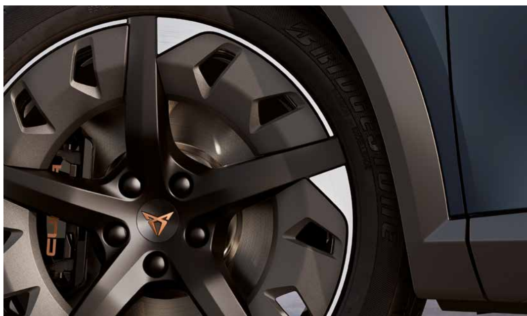
AERO VELGEN 19 INCH IN BLACK MATT/SILVER