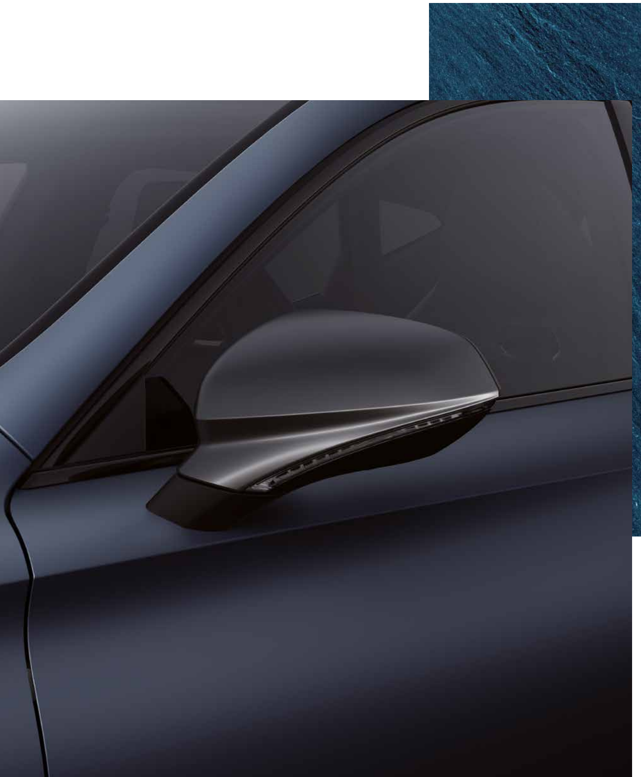
PETROL BLUE (MAT)