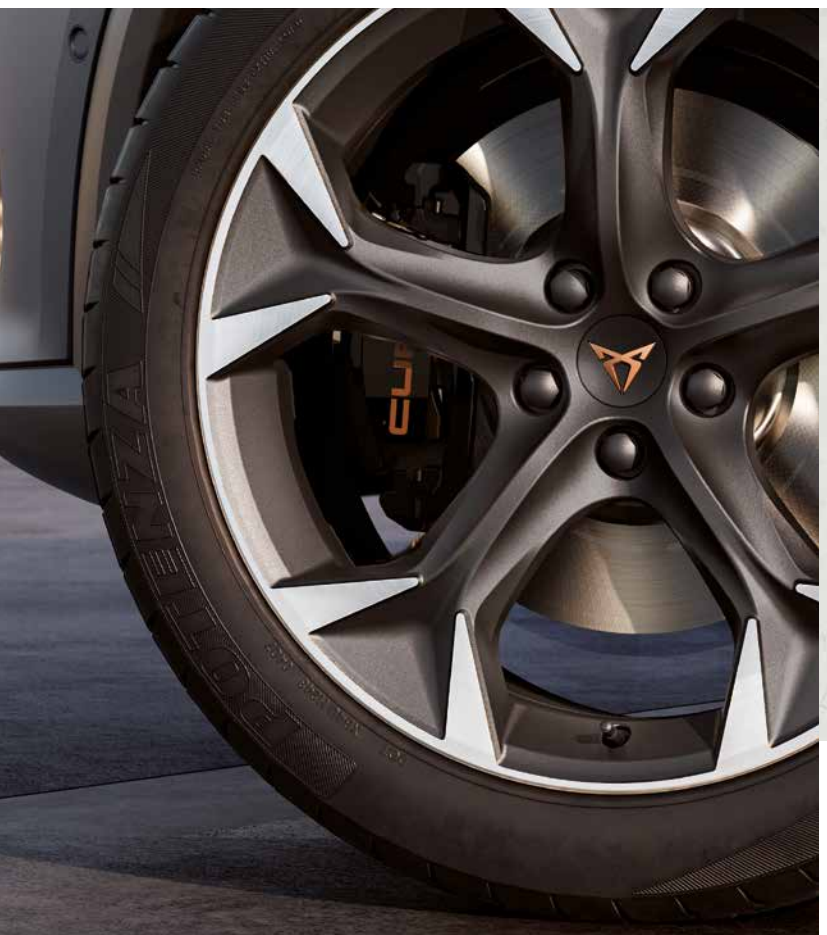
PERFORMANCE 19 INCH IN BLACK MATT/SILVER