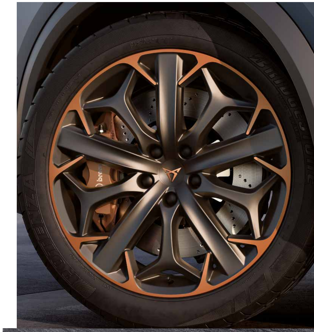
EXCLUSIEF 19 INCH IN SPORT BLACK/ COPPER