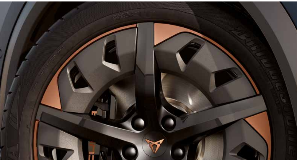
AERO VELGEN 19 INCH IN SPORT BLACK/ COPPER