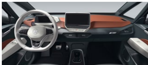
Interieur Safrano Orange/Electric White 1