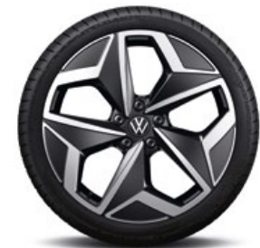
ID.3 1 ST Plus met 19-inch lichtmetalen velgen 'Andoya'