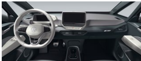
Interieur Dusty Grey Dark/Electric White