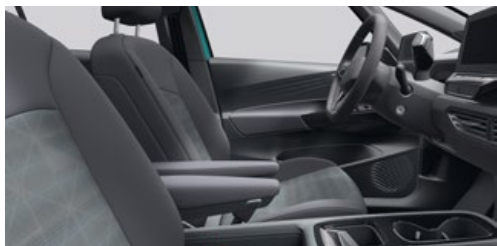
Basisstoel Platinum Grey/Soul