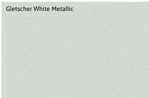
Gletscher White Metallic