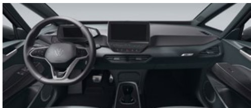
Interieur Platinum Grey/Piano Black