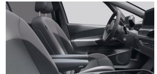
Comfortstoel (Interieur Style 'Plus') 'ArtVelours' Platinum Grey/Dusty Grey Dark