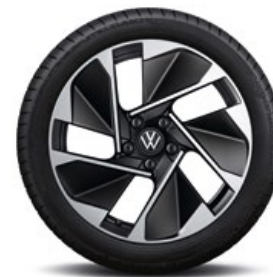
ID.3 1 ST met 18-inch lichtmetalen velgen 'East Derry'